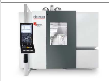
FZ 16 five axis