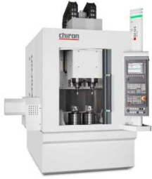
DZ 12 S five axis