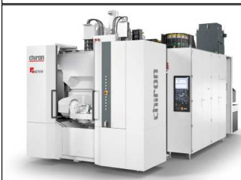
DZ 16 W