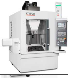
FZ 12 S five axis