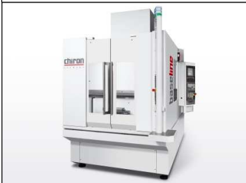
FZ 15 W baseline